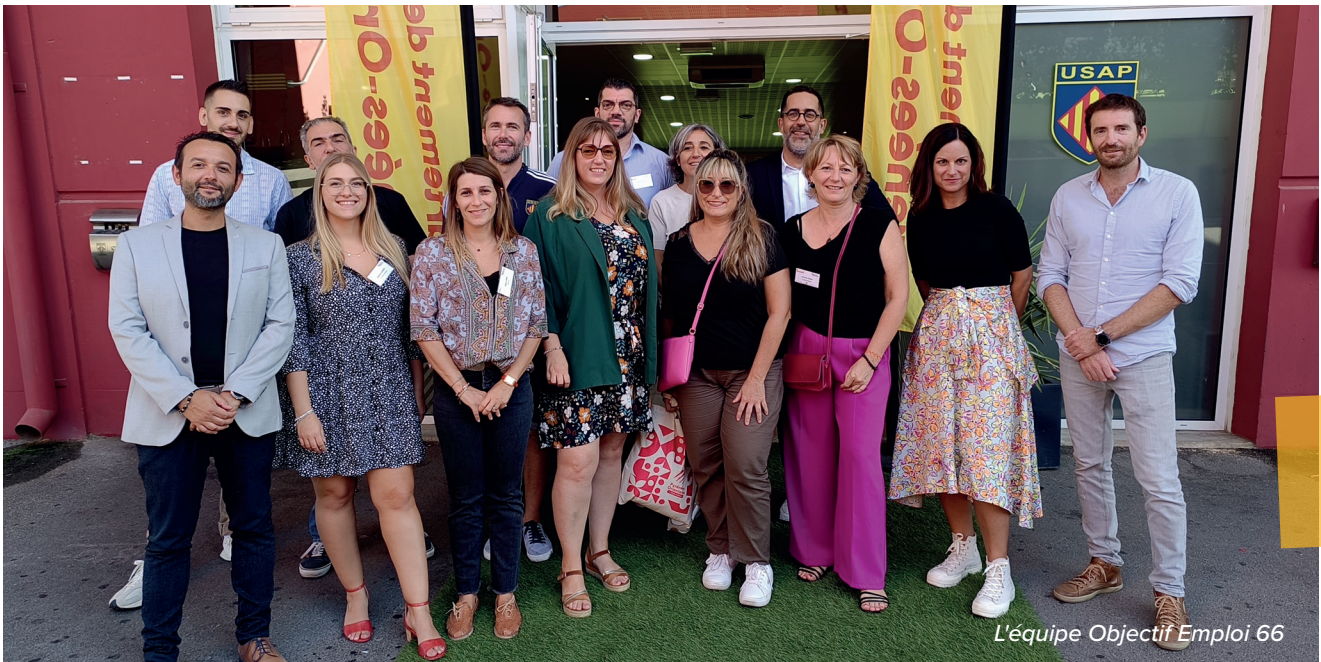
L'équipe Objectif Emploi 66

Nous allons proposer le dispositif "Vis mon job", une initiative immersive qui permet aux allocataires du RSA de vivre une expérience métier directement en entreprise. Les participants pourront tester des métiers, notamment repérés comme « spécifiques » pour mieux comprendre les réalités opérationnelles. Ce partenariat avec le Département des Pyrénées Orientales, permet de promouvoir l'insertion professionnelle auprès des TPE-PME.