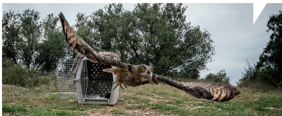
Après une période de convalescence, l'association a relâché ce Grand-duc d'Europe sur les hauteurs de Corbère-les-Cabanes.