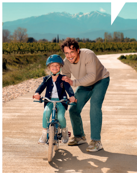
* 500 km de véloroutes départementales ont déjà été créées depuis l'aménagement de l'ancienne voie ferrée entre Perpignan et Thuir livrée en 2004.