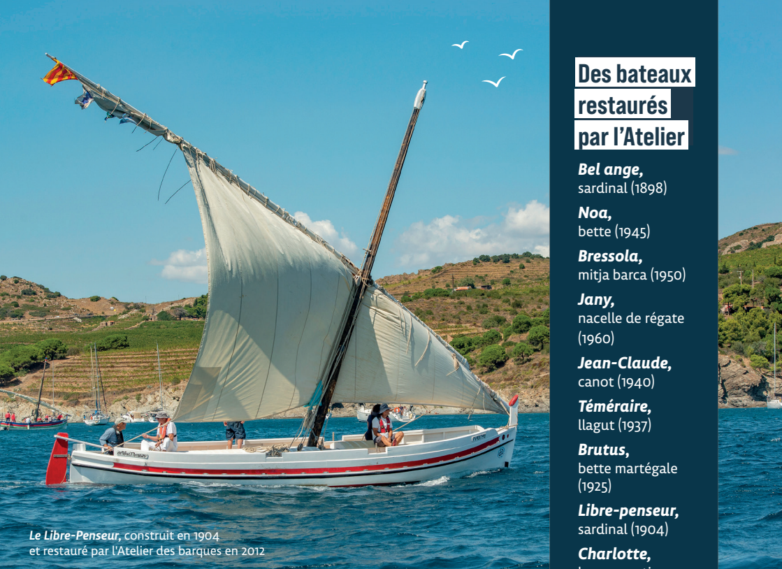
Le Libre-Penseur , construit en 1904 et restauré par l'Atelier des barques en 2012