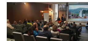
Conferència a l'auditori

El centre acull projectes innovadors sobre les diferents temàtiques així com a empreses i laboratoris dins les oficines i posa a disposició de les empreses un gran espai de coworking a la casa de la innovació. La casa del centre permet, també, proposar al gran públic un conjunt d' activitats i d' eines pedagògiques per tal de millorar els coneixements sobre les energies solars i facilitar així la transició energètica .