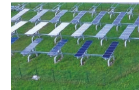
EDF Renewables Central solar fotovoltaica sobre trackers