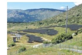
Engie Green Central solar fotovoltaica bifacial