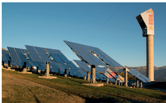
CNRS PROMES Central solar termodinàmica de torre

El laboratori CNRS PROMES coordina diversos projectes relacionats amb la torre i els heliòstats. Les altres empreses treballen en instal·lacions construïdes als terrenys dels voltants.