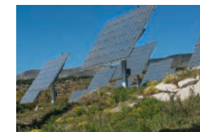
Subsol Central solar fotovoltaica per concentració